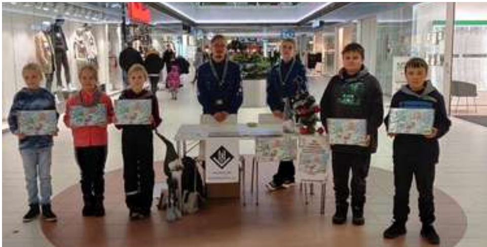
Adventtikalenterien myyntiä Veturissa.

Adventtikalenterien osalta partiolaisemme yllättivät jälleen rikkomalla tänäkin vuonna lippukuntamme myyntiennätyksen - kalentereita myytiin kaikkiaan 806 kappaletta. Kalenterimyynnin ansiosta tilikausi päättyi 84,2 euroa ylijäämäiseksi.