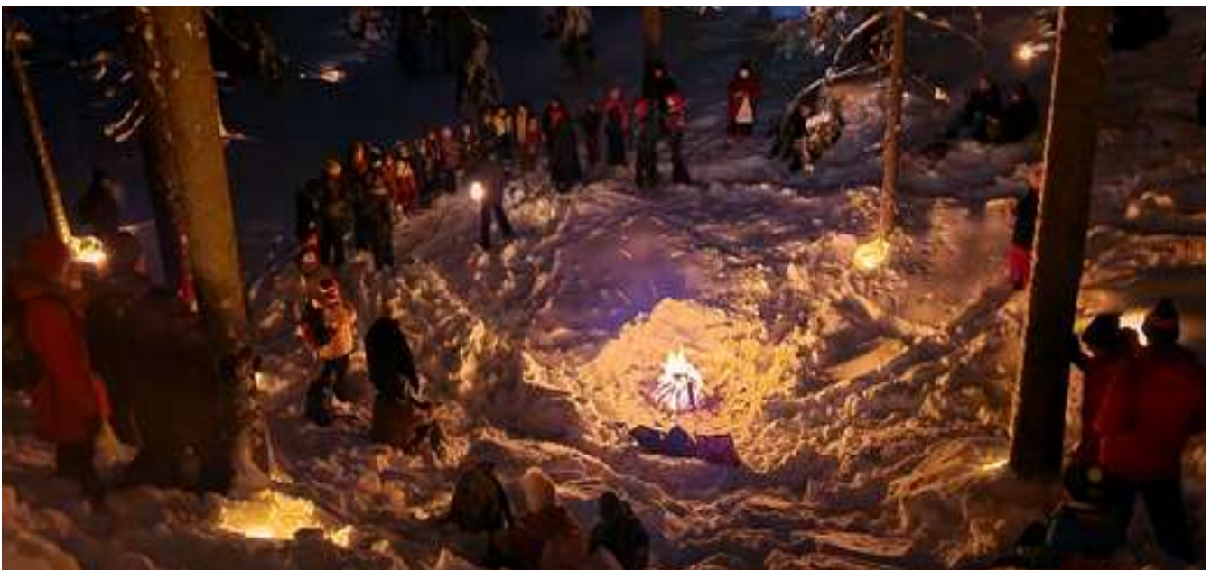
Partiovuosi päättyi jälleen joulu- ja lupausjuhlaan Kämpän maastossa