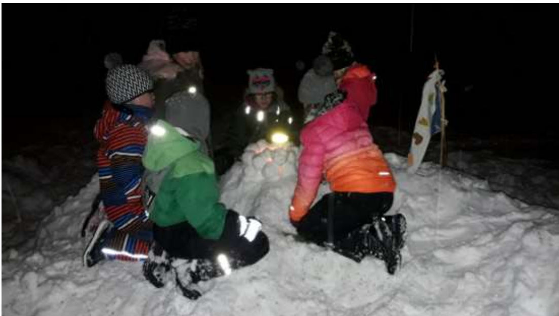
Partiolaiset ulkoilevat säässä kuin säässä. Sudenpennut ovat saaneet lumi-lyhdyn syttymään.