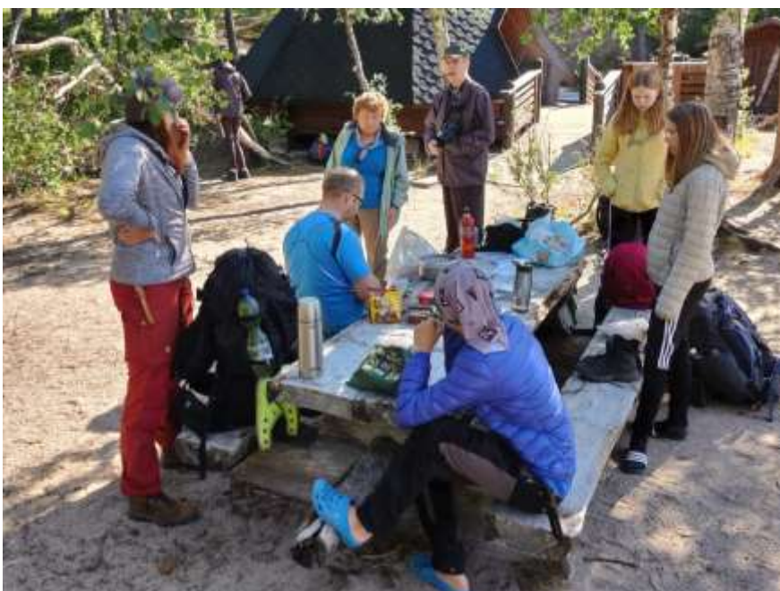
Kolmisoihdun retkillä syödään perinteisesti hyvin – tai ainakin paljon.

Lippukunnan syyskokouksessa lippukunnan säännöt uusittiin Suomen Partiolaisten nykyisten mallisääntöjen mukaisiksi. Syksyllä uusittiin myös lippukunnan nettisivut ja otettiin Instagram-tili @kolmisoihtu aktiiviseen käyttöön.